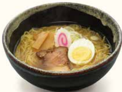
鶏がらスープの塩ラーメン