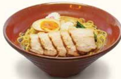
あごだし自家製チャーシュー麺

新商品 鶏がらスープの塩ラーメン ..... ¥1,000- 能登塩を使ったコクのある手作りスープがクセになります。