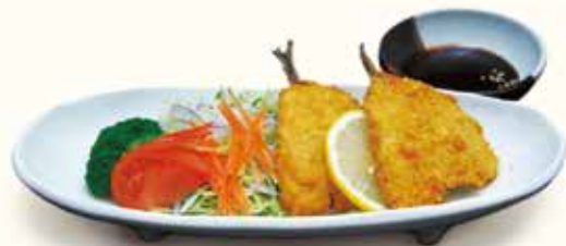
サクサク鱈フライ